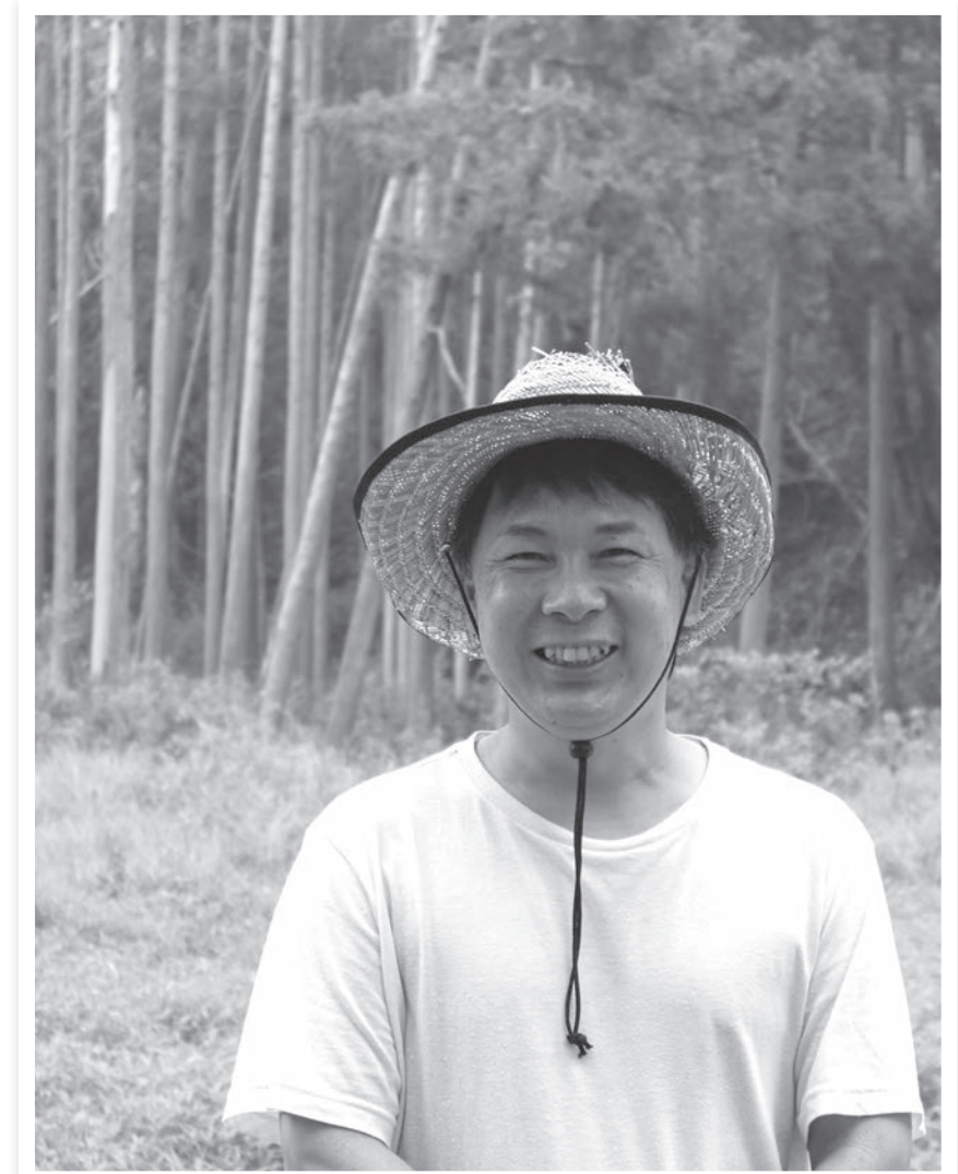
温泉旅行でたまたまこのホテルに来たというお客様でも、シェアリングネイチャー体験を通して「視野が広がり世界も広がった」と思ってもらえるような、プログラムを日々実践しています。

「中学生の頃から、人は自然と離れた暮らしをすると心身を壊すと漠然と感じていたことも、この道に進んだ理由